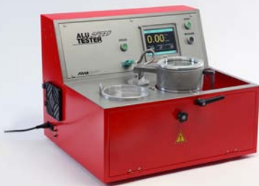
Aluspeed 四功能快速定量测氢仪