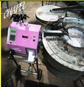
CHAPEL 便携式连续定量测氢仪