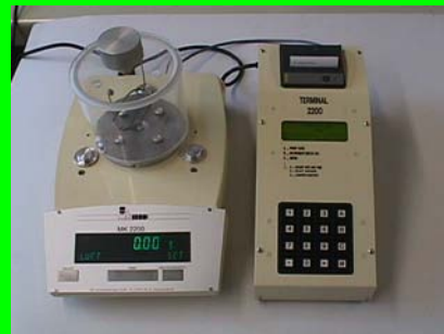
密度指数电子天平及打印机